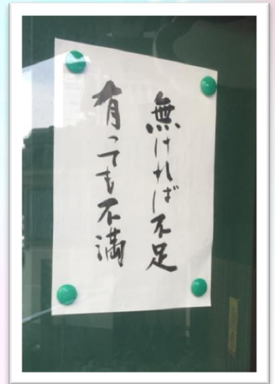
通勤時、いつも通る道にあるお寺の掲示板の言葉です。毎朝、目にするうちに言葉の奥深さに気づいていきます。ここに幸せのヒントがあるように思います。 藤村祐司