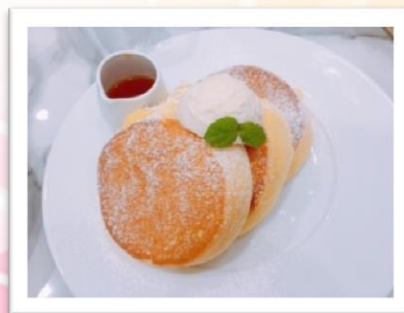
幸せのパンケーキ、 本当に美味しかったです。 谷口敬亮