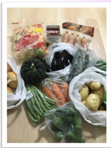
実家から自家栽培の野菜が届きました。自分のことを想ってくれる家族の存在を有り難く感じます。大好きな珈琲牛乳も一緒に入っていて余計に嬉しかったです。 坂下宏彰