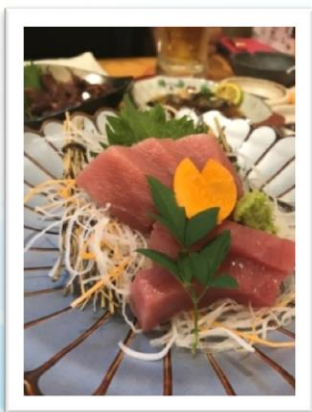
お刺身が美味しい。 しかし、この一皿で1,980円！！ 岸本圭司