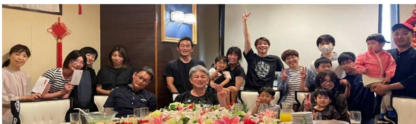
↑6月開催ボウリング大会後の様子